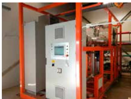
Rovato (BS) - Produzione elettrica da caldaia alimentata a biomassa (pallet a fine vita)