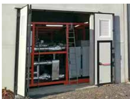
Città della Pieve (PG) - Produzione elettrica da caldaia alimentata a biomassa (sfalci di potatura)