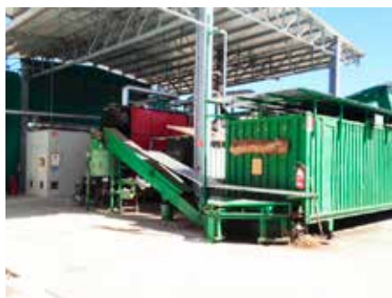
Sommalombardo (VA) - Produzione elettrica da caldaia alimentata a biomassa (scarti di segheria)

Le seguenti foto sono solo una piccola galleria di alcuni degli impianti installati.