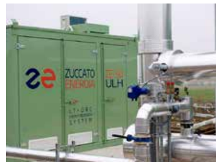
Borgoforte (MN) - Recupero termico da camicie e fumi di scarico di gensets a biogas

Per un elenco più aggiornato e molto più esteso di nostre referenze, vi consigliamo di consultare la sezione "Referenze" del nostro sito web, www.zuccatoenergia.it .