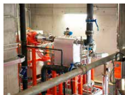
Mestre (VE) - Recupero termico da caldaia a biomassa e da turbine ad aria calda