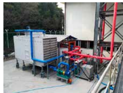
Heuksan (Corea del Sud) - Recupero termico da centrale termoelettrica (generatori ad olio pesante)