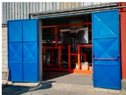
Castrovillari (CS) - Produzione elettrica da caldaia alimentata a biomassa (sfalci di potatura)