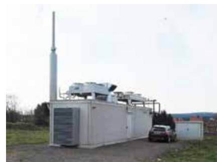
Benneckestein (Germania) - Recupero termico da camicie e fumi di scarico di gensets a biogas