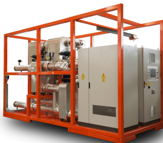
*Soluzione per interno