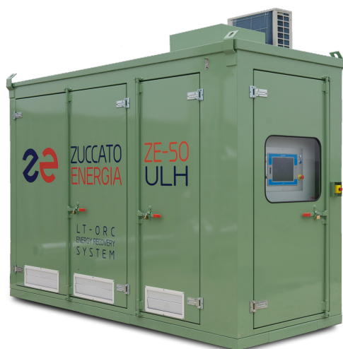
*Soluzione per esterno

Industria petrolchimica Vetreria Industria alimentare Metallurgia Ceramificio Cartiera